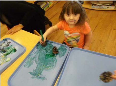
Serilia pintando una piña.